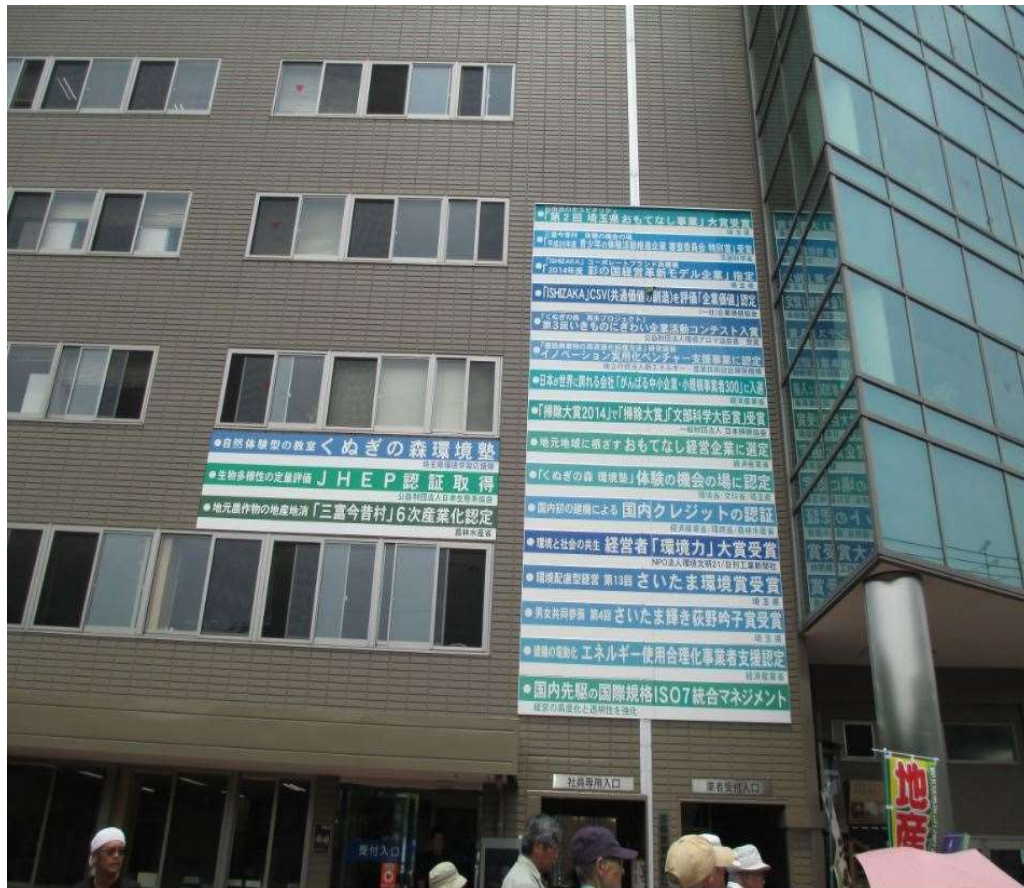
石坂産業の入口に掲げられた各種の受賞内容

5月31日(水)に埼玉県入間郡三芳町の石坂産業株式会社を訪問しました。石坂産業は近年、素晴らしい環境技術により、環境保全と社会貢献活動を行っている企業として有名になり、環境活動を行っている人達の訪問が続いている会社です。かつては、廃棄物処理で問題を起こしたこともありましたが、現在は、環境を保全する活動が評価されてたくさんの表彰を受けるようになり、模範企業として一躍注目を浴びています。