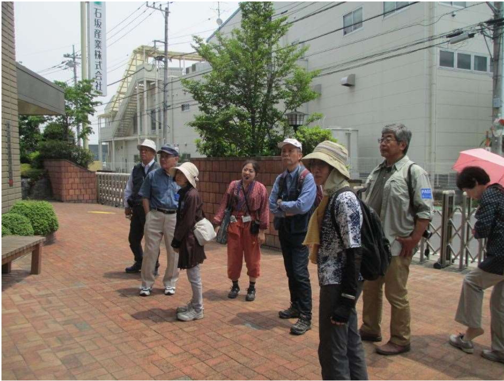
見学会への参加者