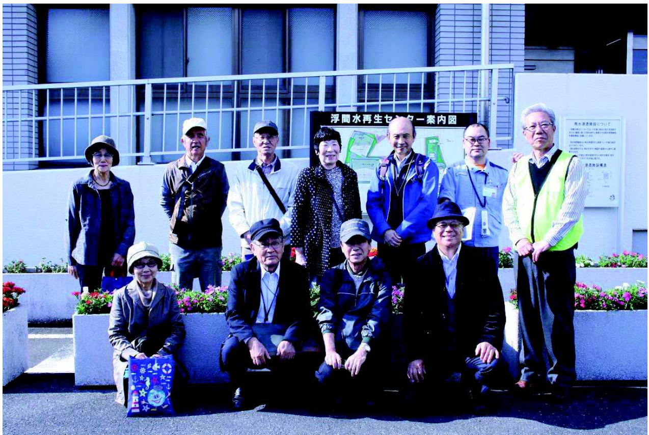
2017年11月7日(浮間水再生センターにて) 説明してくれた都職員と記念撮影

・又、リンは余剰汚泥の中に取り込まれ焼却灰として処理されているが、岐阜市では焼却灰からリンを回収し、リン酸カルシウム肥料「商品名:岐阜の大地」を商品化している。